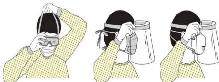
Figura 2: Secuencia de colocación de máscara.