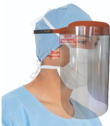
Figura 3: Correcta ubicación de la pantalla.